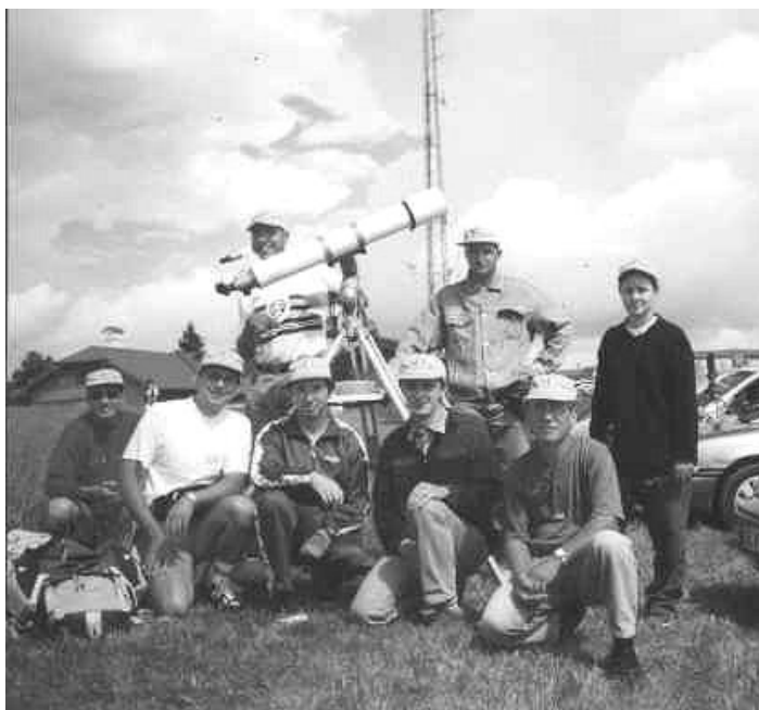
Foto di gruppo dei partecipanti alla gita in Austria.